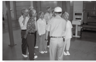
従業員の家族招待会