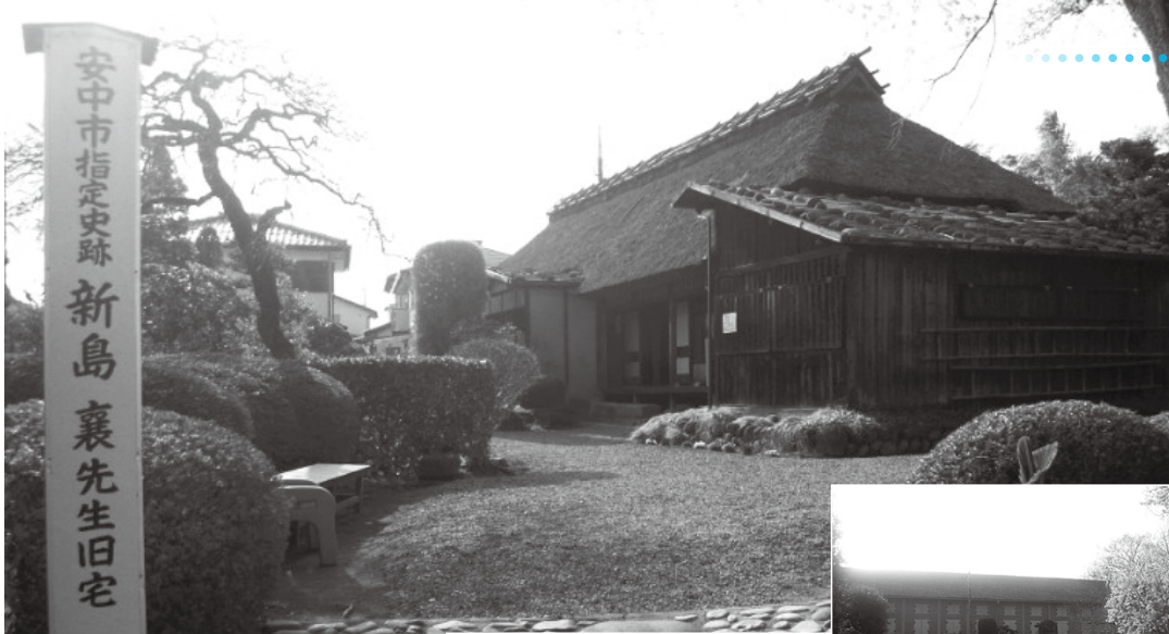
安中市指定史跡 新島襄先生旧宅