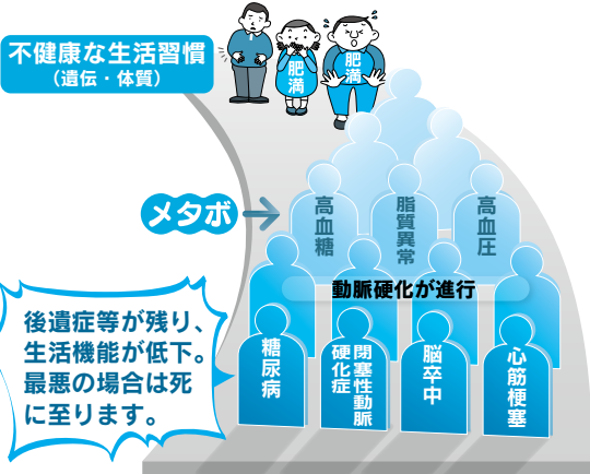
図1 メタボリックドミノ

メタボは腹部肥満をはじめ、糖代謝異常（糖尿病の手前）、脂質異常、血圧異常（血圧が高め）を複合した状態です。これらの前病段階はいずれも長い年月をかけて血管を傷つけて動脈硬化をきたし、やがて糖尿病や高血圧になります。そして、さらに年月を経て脳卒中や心筋梗塞へと至ります。脳卒中や心筋梗塞は動脈硬化の最終段階です。発症したときにはほかの血管も詰まりかけている可能性があります。目の血管が閉塞すれば失明、足の血管が詰まれば壊疽となり足を切断することになります。自律神経の血管、腎臓の血管。人間の身体は血管だらけですので、動脈硬化を予防するのはとても大切なことです。もちろん、