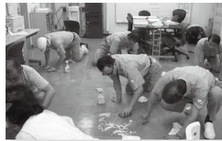
工場の床を磨きながら、心も磨きます