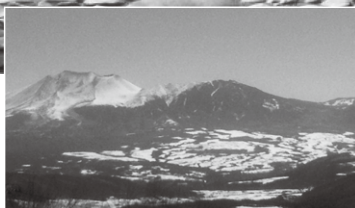
万座ハイウェイからの山並みと浅間山