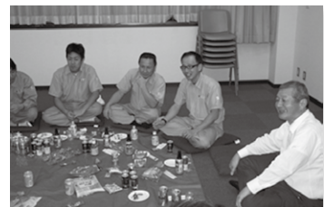
社員間の交流を深める「ブルーシートの会」

また、特殊健康診断として騒音検査、VDT検査、有機溶剤等検査を該当従業員に年2回必ず行い、あわせて作業環境測定を実施しながら、ハード、ソフトの両面から安全や健康を推進しております。